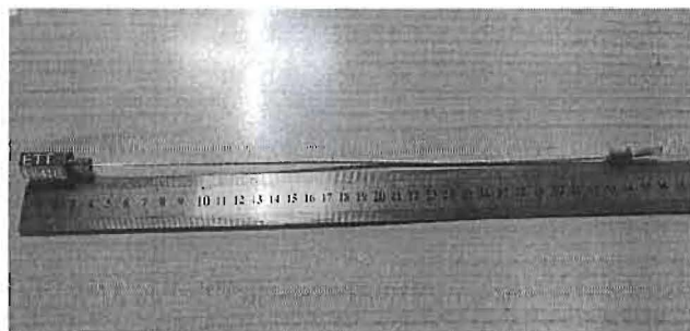
Зураг №1. ЕТТ лацны одоогийн зураг.