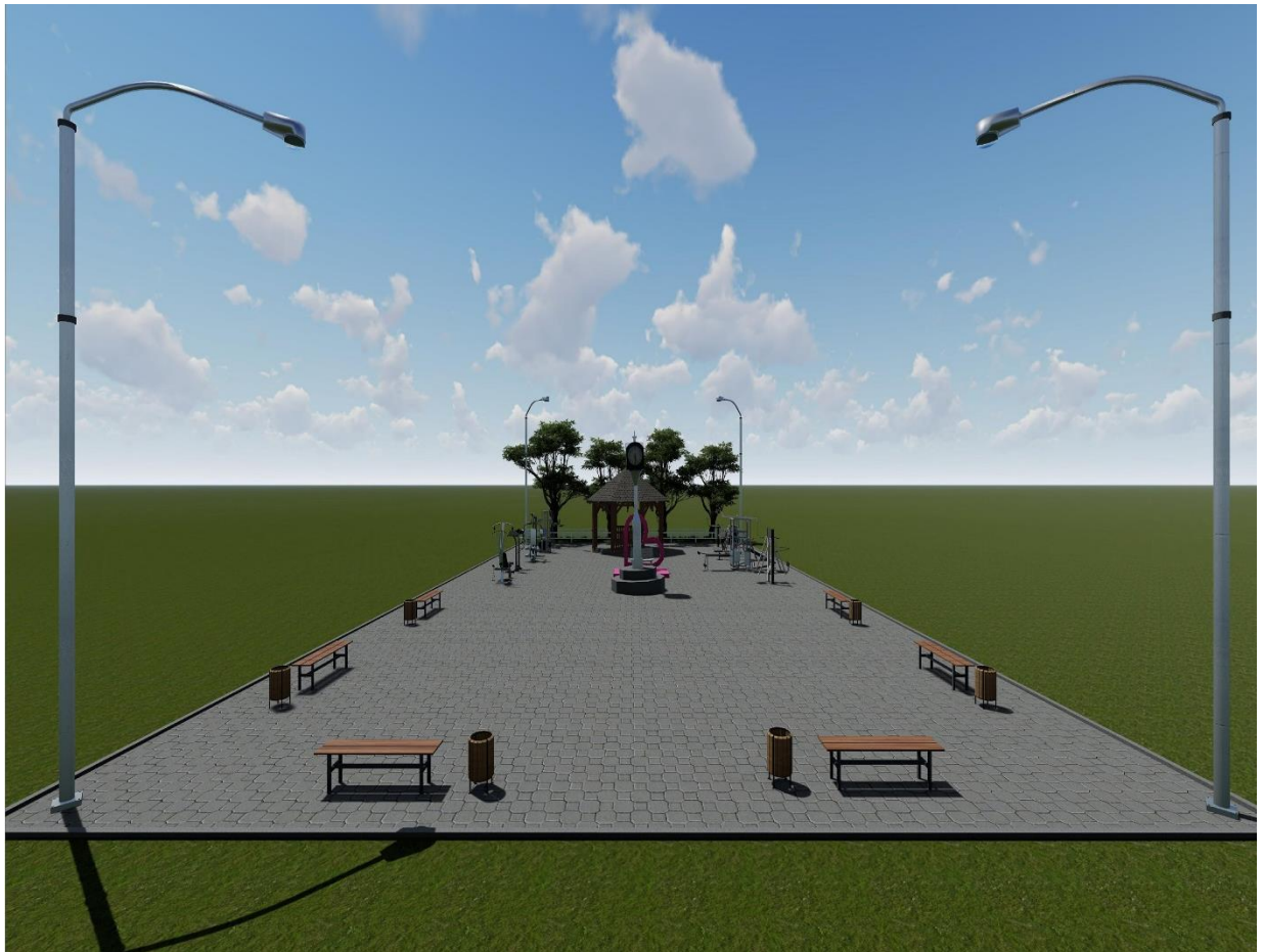
Зургаа. ҮЕ ШАТНЫ АЖЛЫН ХУВААРЬ