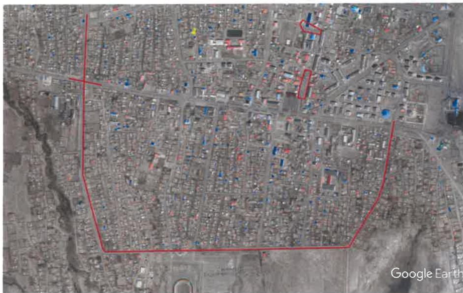
Баруун тойргийн автозам

Талбайн зураглалын ажил нь “Цикло трейд” ХХК-тай зөвшилцсөн техникийн даалгаварын дагуу 2020 оны 04 дугаар сарын 1-наас 2020 оны 04 дугаар сарын 10-ны хооронд Kolida K9 mini маркийн 2 ширхэг GNSS ашиглаж хээрийн хэмжилтыг хийж гүйцэтгэсэн.