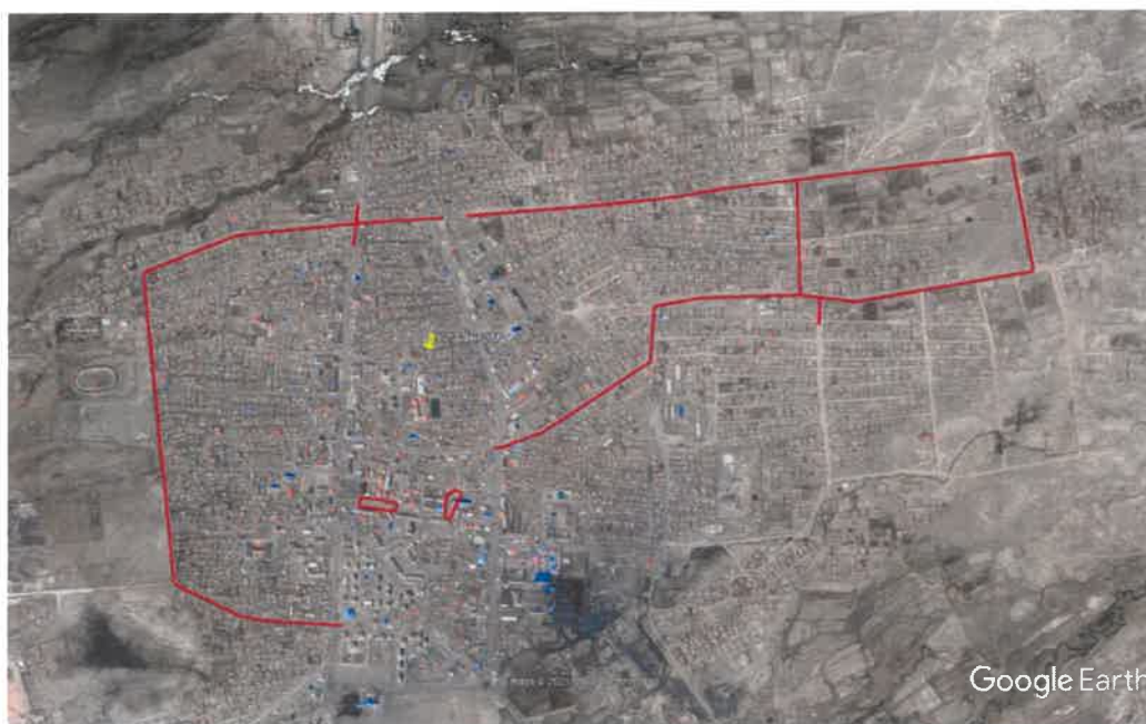
Ажил гүйцэтгэсэн талбайн байршлын схем

Судалгааны үе шат: Нарийвчилсан геодезийн судалгаа