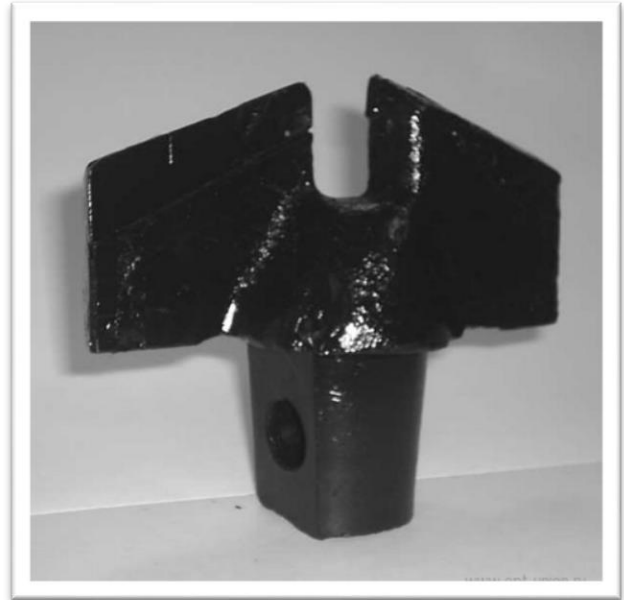
Зураг №2 харагдах байдал