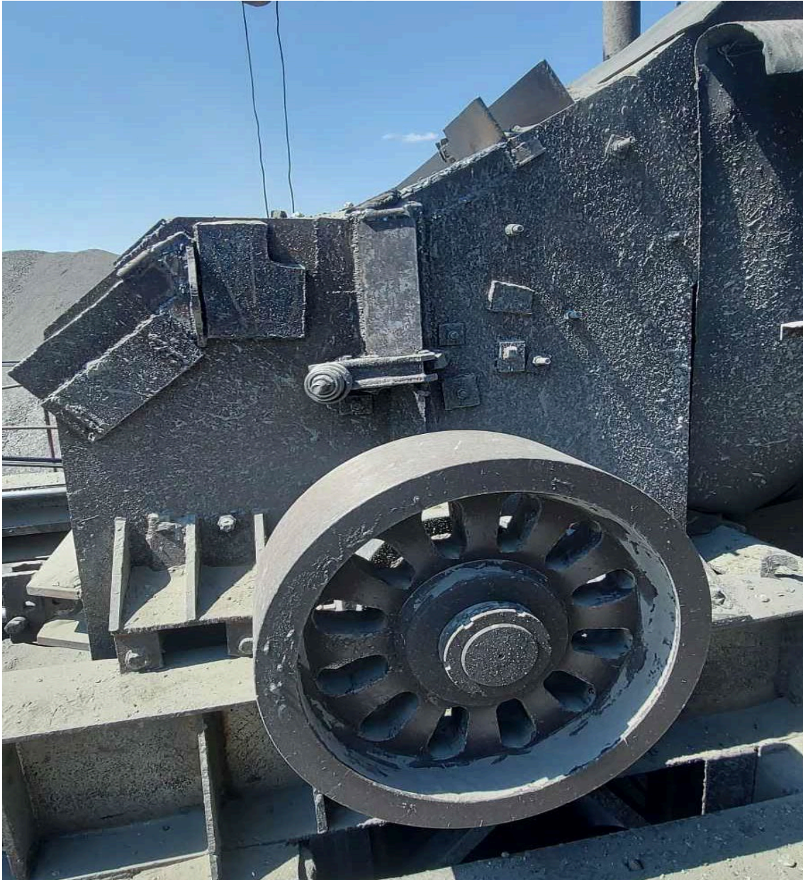
Алхан бутлуурын одоогийн бодит фото зураг