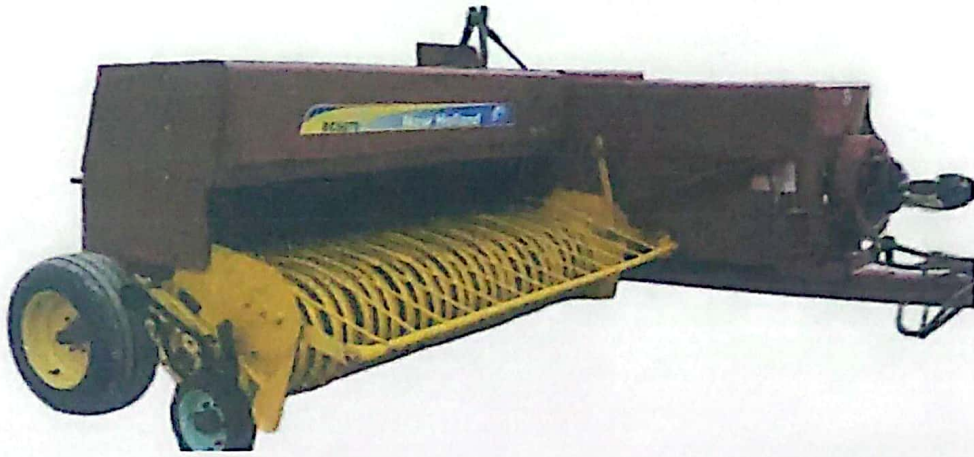
ҮРЭЛГЭЭНИЙ МАШИН ОМИЧКА СКП-2.1