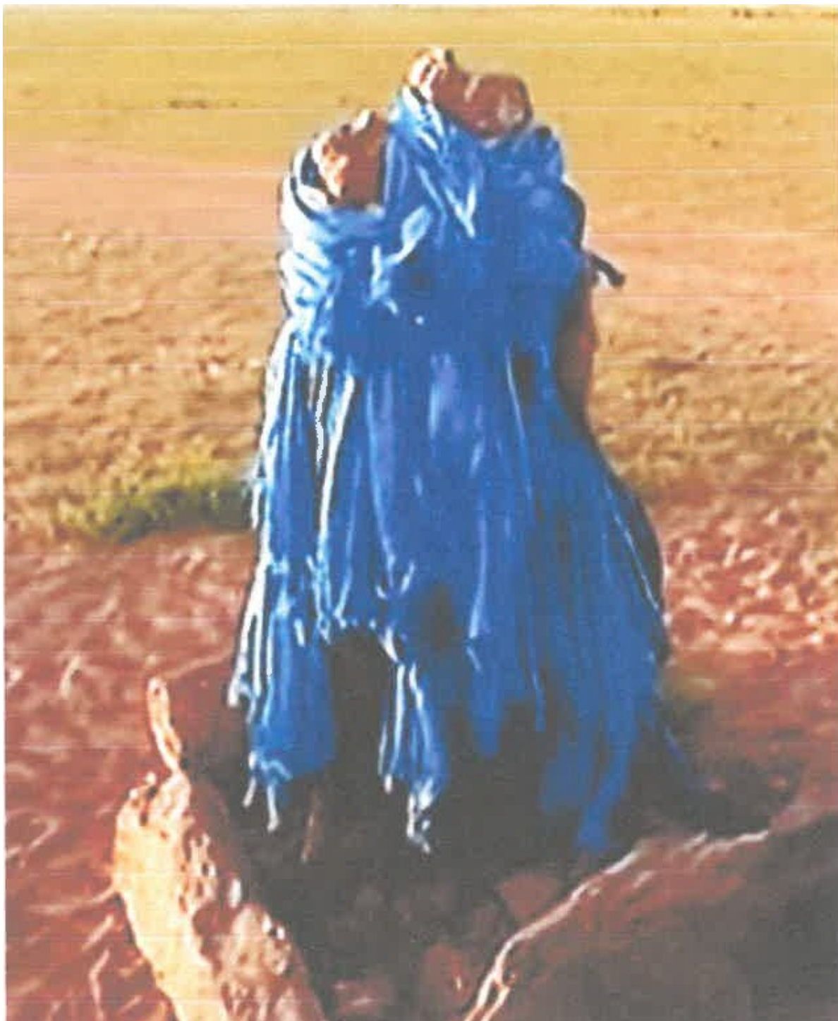
“Гүүн зэлний эх” дурсгал

Мөн голын урд хөндийд Доной баяны гүүн зэл гэж нэрлэгддэг дурсгал байдаг. Долоон үеэрээ баян явсан долоон мянган адуутай Доной баян нутагладаг байсан. Доной баяны адуун сүргээс шувуун саарал гарсан гэдэг домог яриа байдаг. Зэлний эхнээс нөгөө үзүүр хүртэл 500 гаруй метр. Зэлний эхэнд мөргөсөн хүн баяждаг гэж ярьцгаадаг байна.