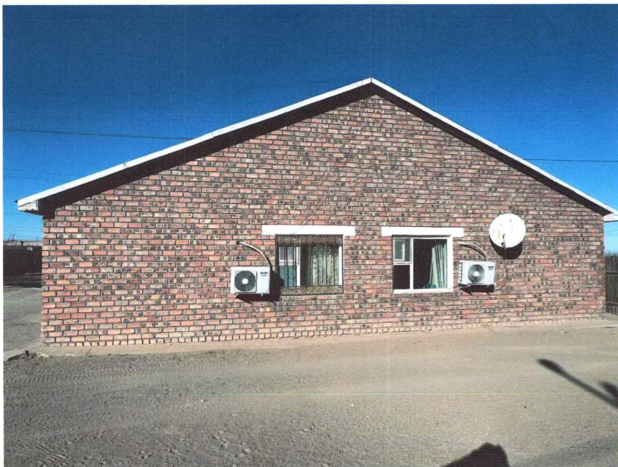
Жавхлант баг Гоёотын 9-902