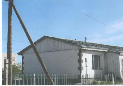
4 Айлын орон сууцны хажуу талаас харагдах байдал хэмжээ