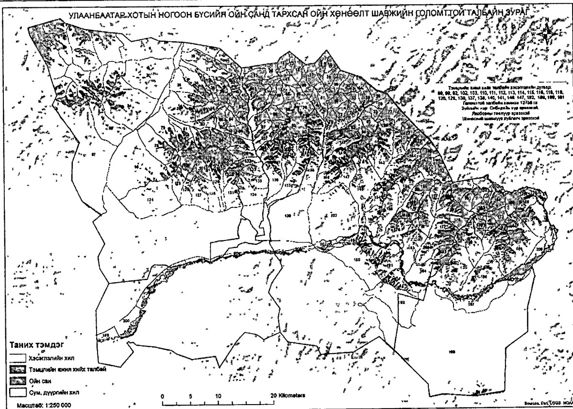
Тэмцлийн ажил гүйцэтгэх талбайн зураг