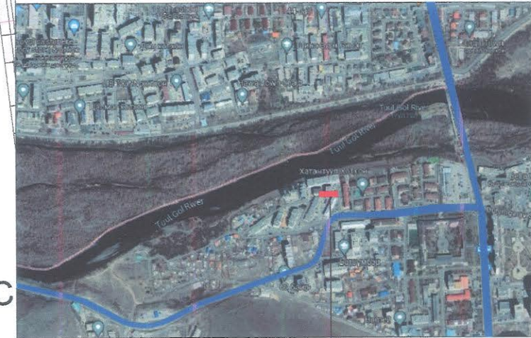
22-р хорооны байр