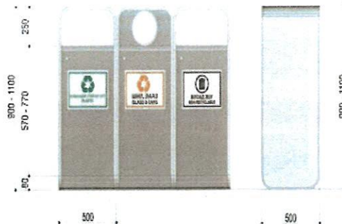
Зурэг 1. Гудамж, талбайн хогийн сав жилиээ загвар