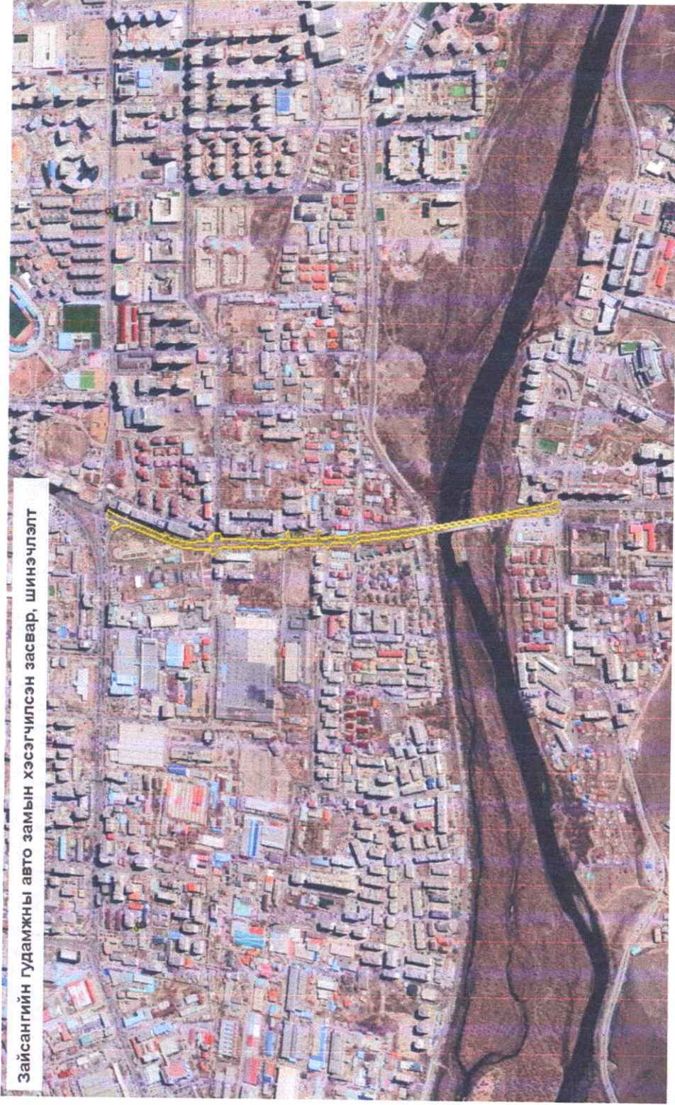
Зайсангийн гудамжны авто замын хэсэгчилсэн засвар, шинэчлэлт

Газрын зориулалт Авто зам, замын байгууламж