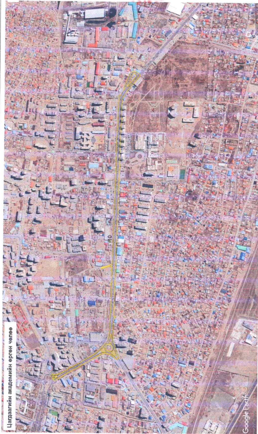
Цагдаагийн академийн өргөн чөлөө