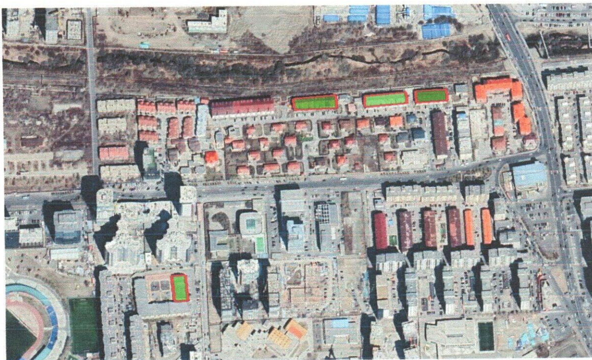
Хан-Уул дүүргийн 19 дугаар хороо 15-1, 15-2, 59, 87 дугаар байрны дээвэр засвар