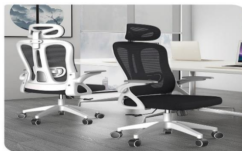
Эргономик сандал 🪑

Сандалын нуруу хэсэг нь С хэлбэрийн муруйлттай учир суухад нурууны ачааллыг зөв дэмжинэ.