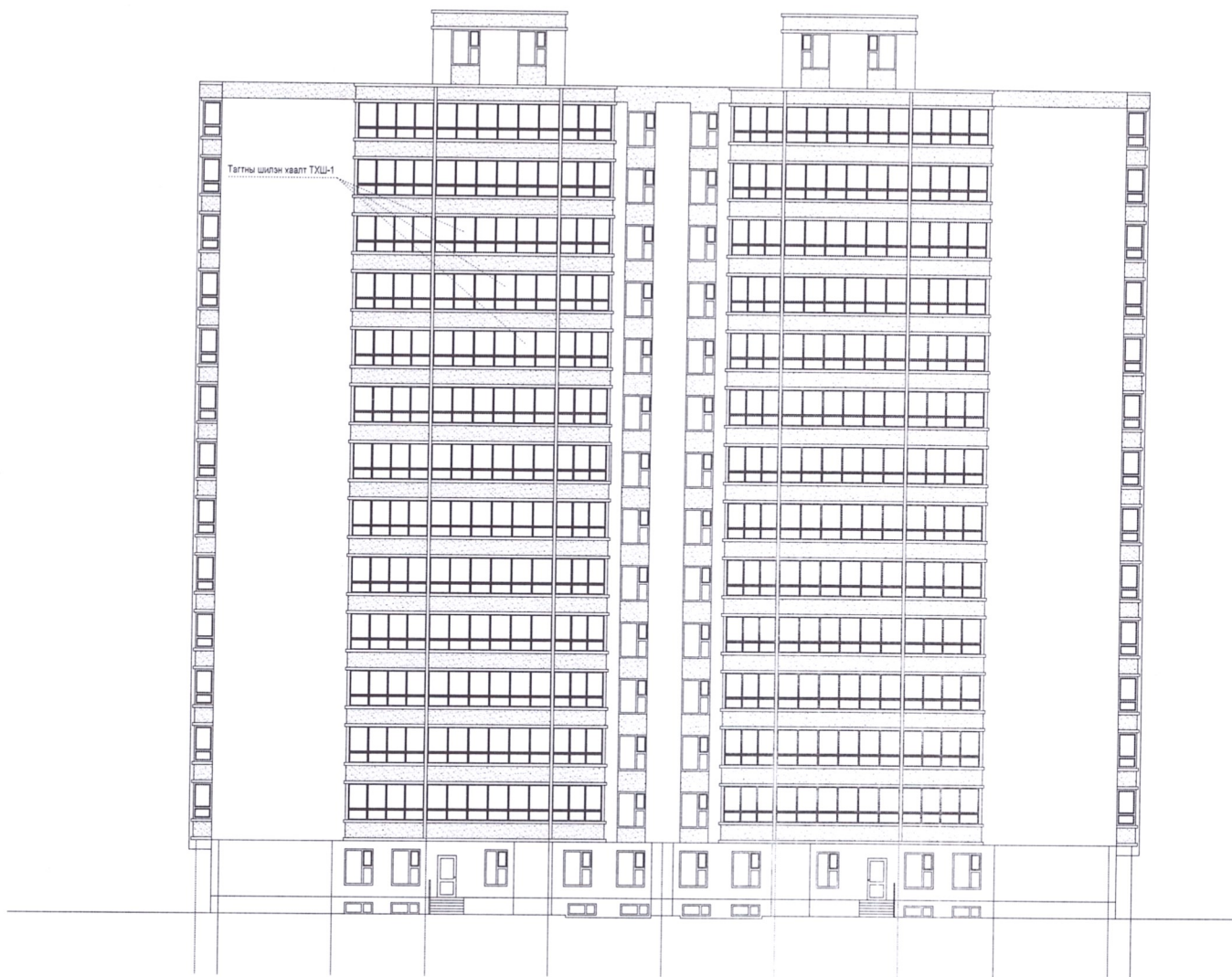
Тагны шилэн хаалт ТХШ-1 /26 ширхэг/