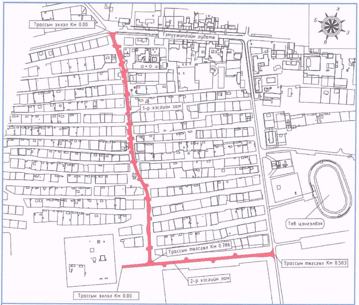
Зураг-1, Авто замын байршлыг зураг