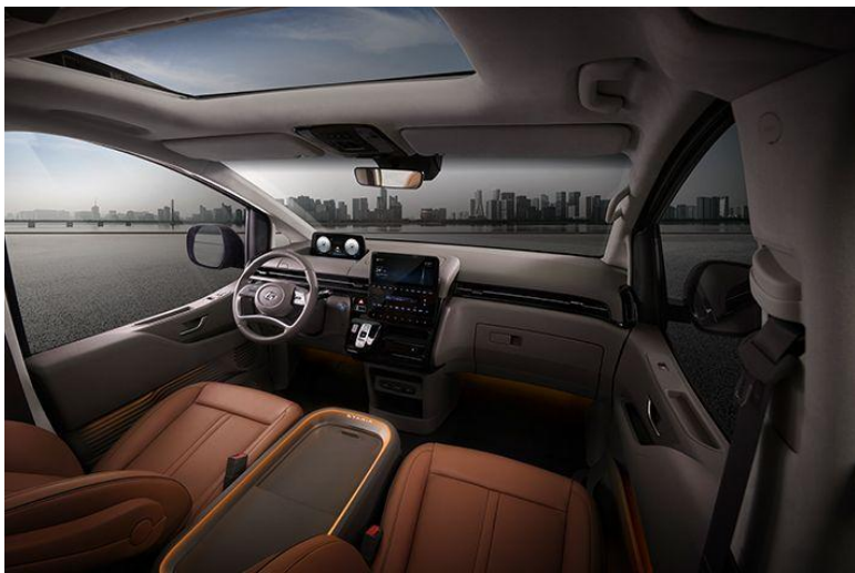
8 инчийн мэдрэгчтэй дэлгэц