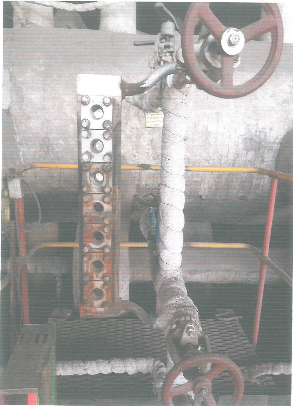
Зураг №2 /түвшний хэмжүүр/