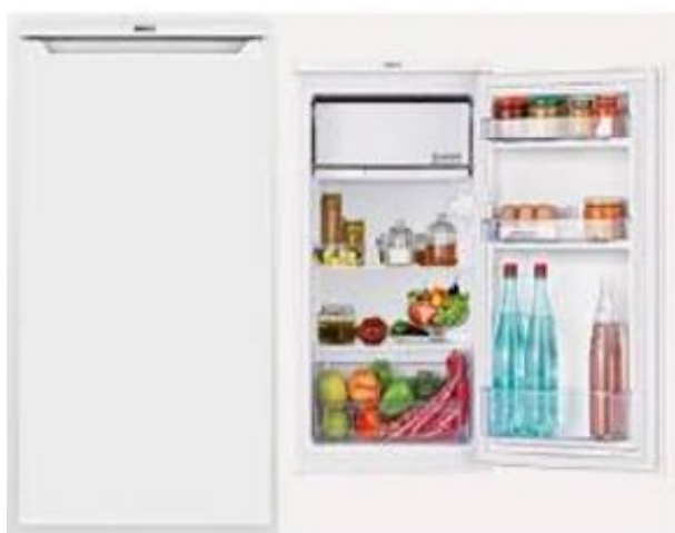
Хөргөгч /1 хаалгатай/ 90л багтаамжтай л 82*47 5*53см цагаан