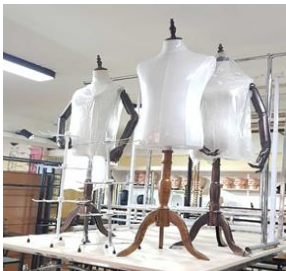
Маникан эр, эм