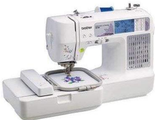
Машины загвар 67 үйлдэлтэй хатгамлын машин