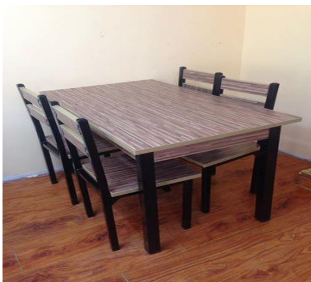
Хоолны ширээ, 4 сандал, шаргал өнгөтэй