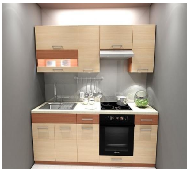
Хоолны шүүгээ, тавиур, угаалтуур