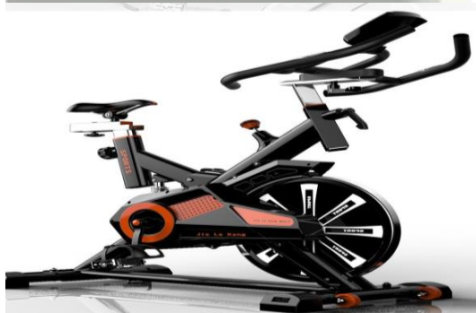
2. Стандарт: Шинэ, дасгал хөдөлгөөн хийхэд зориулагдсан байна.