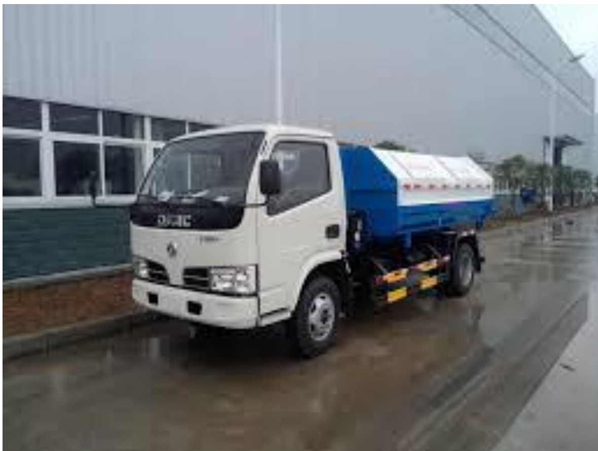
Үүрч ачигдах хогийн савны хэмжээ

Dongfeng Dfac /eq1060/ буюу түүнтэй дүйцэхүйц