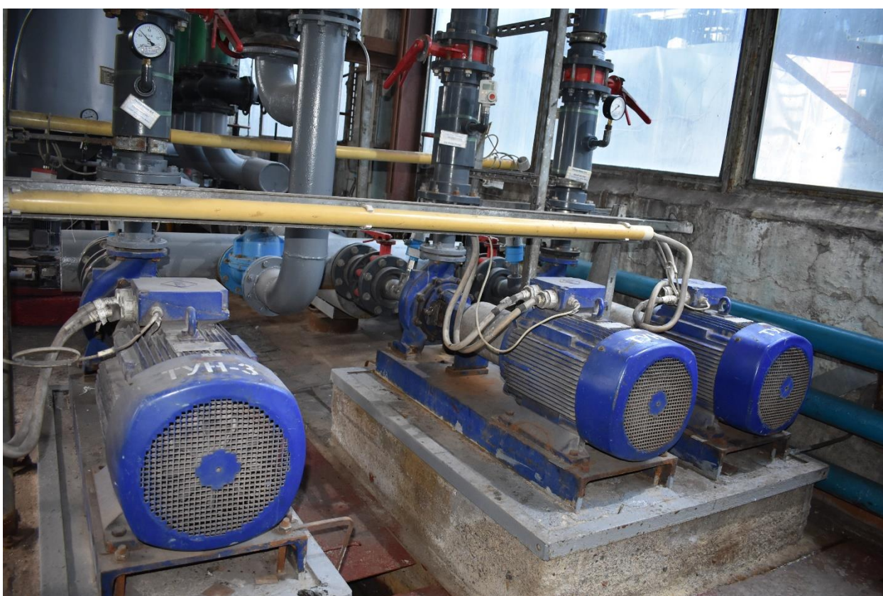
Зураг 4. Хими ус бэлтгэлийн түүхий усны насосууд