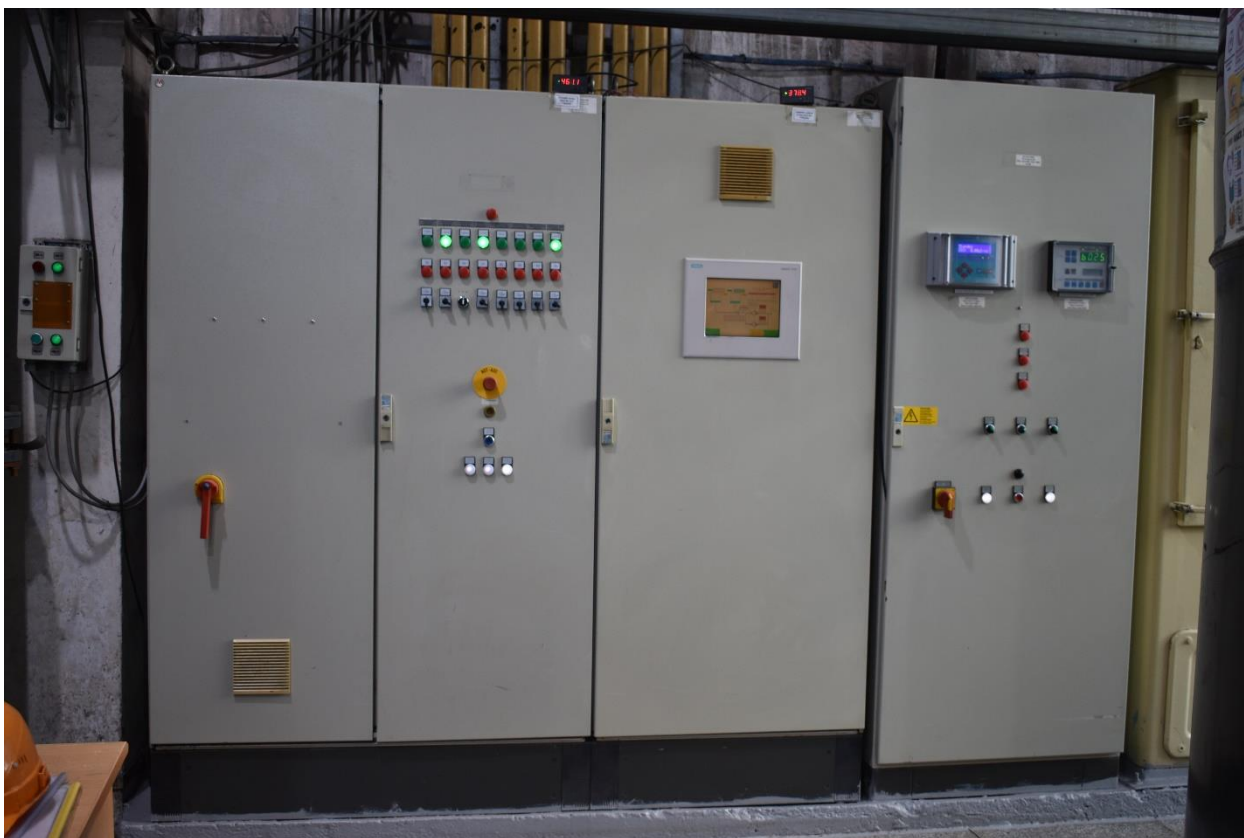
Зураг 1. Хими ус бэлтгэлийн удирдлагын шкафууд