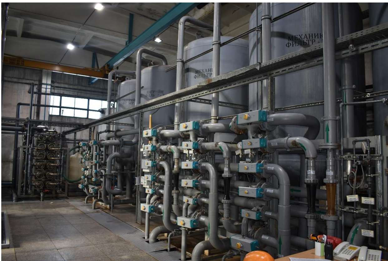
Зураг 3. Механик болон натрийн фильтруудийн удирдлага болон гүйцэтгэх механизм