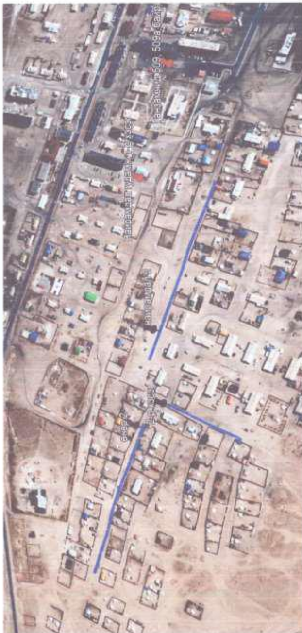
Сайншанд сумын гэр хороолол дундах гэрэлтүүлгийн толгой шинэчлэх ажил 7 дугаар баг

Цамхагт гэрэлтүүлэг – 11 толгой Гудамжны гэрэлтүүлэг – 20 толгой