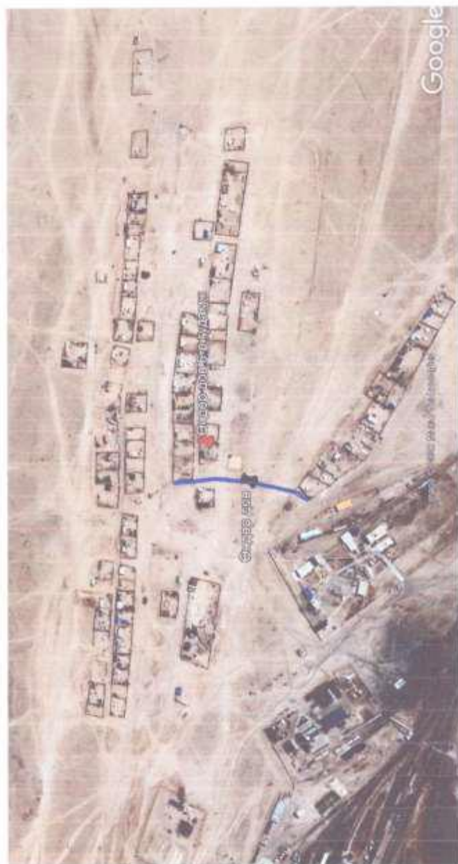
Сайншанд сумын гэр хороолол дундах гэрэлтүүлгийн толгой шинэчлэх ажил 4 дүгээр баг