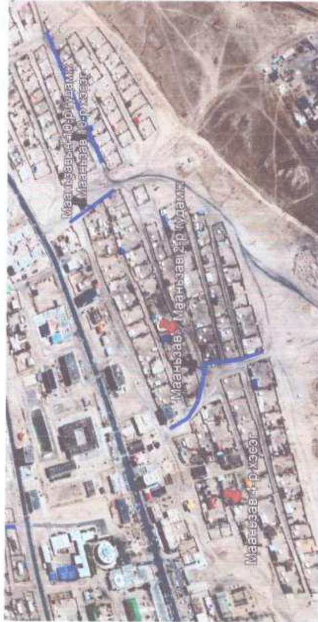
Сайншанд сумын гэр хороолол дундах гэрэлтүүлгийн толгой шинэчлэх ажил 3 дугаар баг