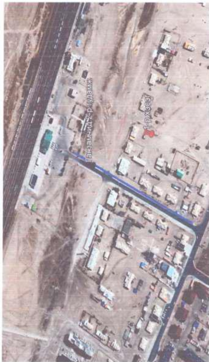
Сайншанд сумын гэр хороолол дундах гэрэлтүүлгийн толгой шинэчлэх ажил 4 дүгээр баг