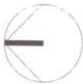
Берилгь : халавчны байгуулалт

PRODUCED BY AN AUTODESK EDUCATIONAL PRODUCT