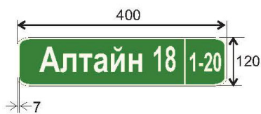
А.1.2-р зураг - Гэр хорооллын гудамжны хаягийн тэмдгийн хэмжээ