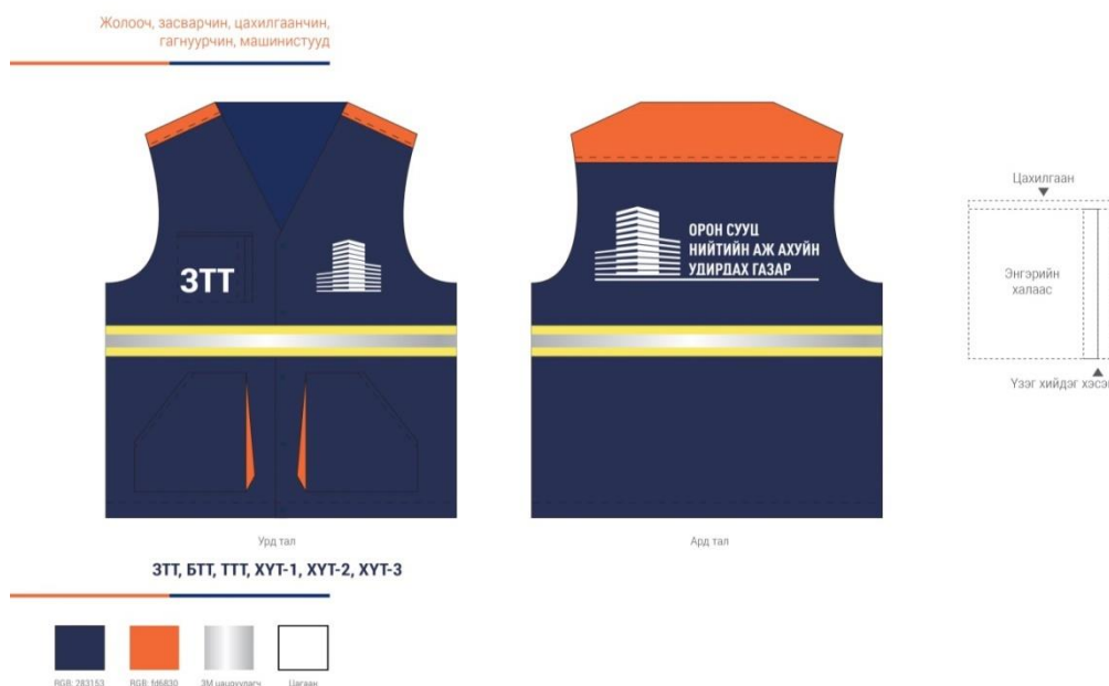
Зураг 2: Ажилтнуудын хантаазны загвар