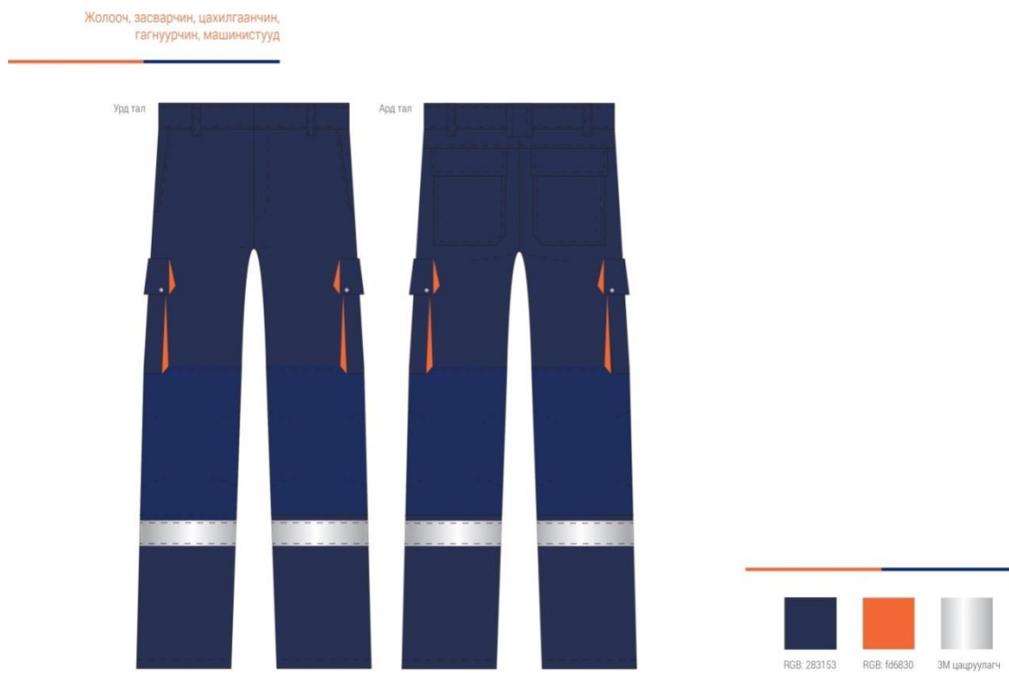
Зураг 3: Ажилтнуудын зуны өмдний загвар

Зуны өмдний загвар, хийц, зохион бүтээлт нь 3-р зурагт үзүүлсний дагуу байна.