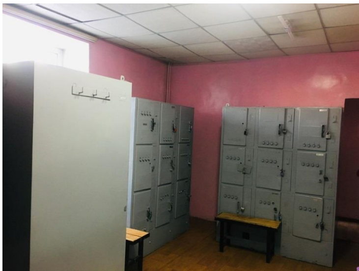
Зураг №3. Улаанбаатар ТҮГ-ын эрэгтэй ажилтануудын хувцас солих өрөөний зураг