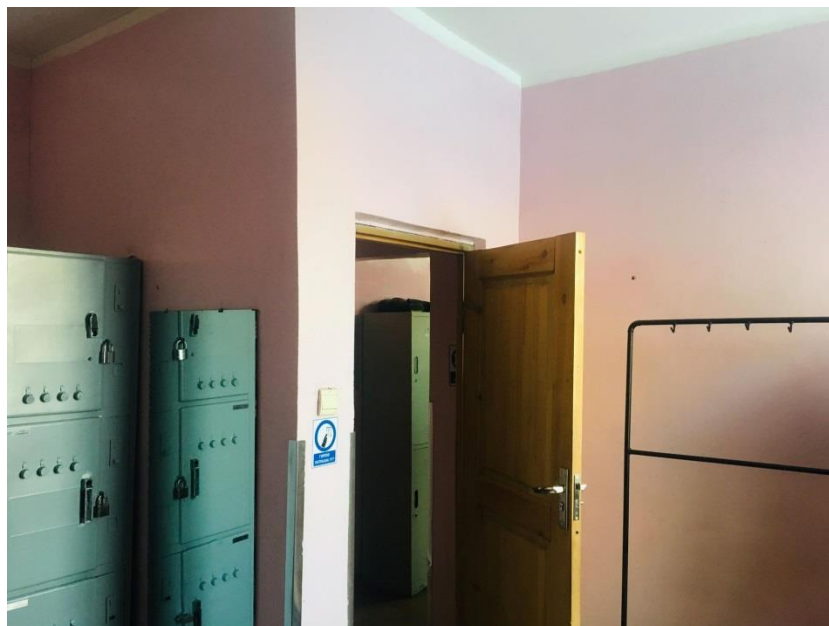
Зураг №4. Улаанбаатар ТҮГ-ын эмэгтэй ажилтануудын хувцас солих өрөөний зураг