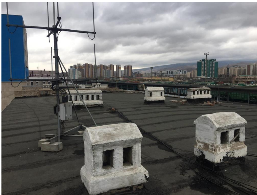
Зураг №1 . Вагон ашиглалтын депогийн дээврийн зураг