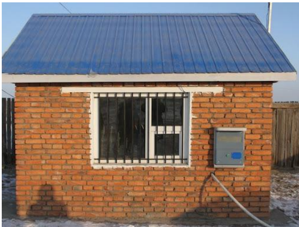
Худгийн ерөнхий байдал