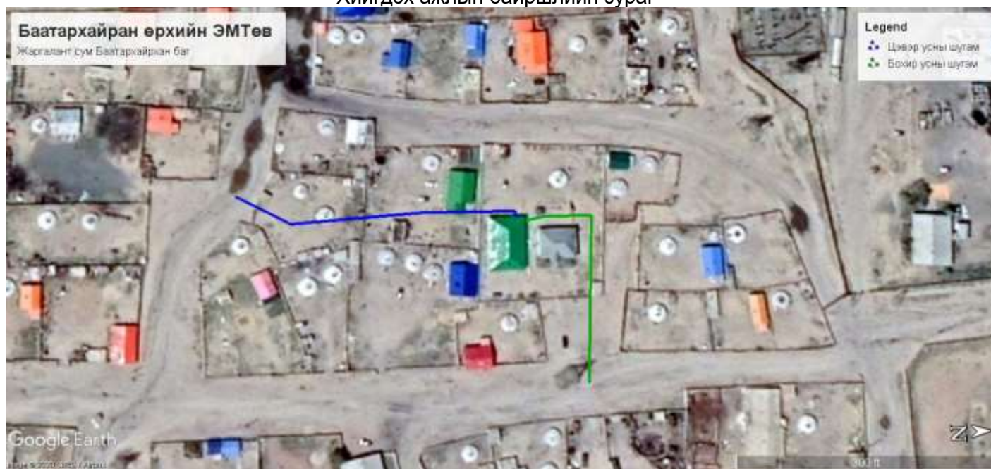
Хийгдэх ажлын байршлийн зураг