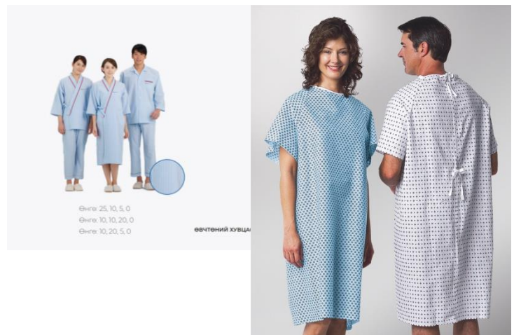
Зураг. Өвчтөний хувцас, ангио хийлгэх Өвчтөний халад