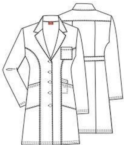
Зураг. Эмч халад эм