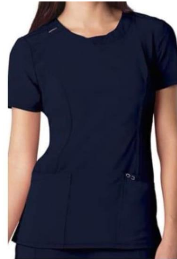
Зураг. Сувилагч, дүрс оношилгооны техникч, лабораторийн техникч