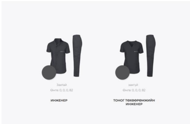
Зураг. Инженер тоног төхөөрөмжийн ажилтан