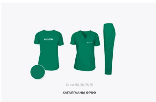
Зураг. Хагалгааны ерөөний хувцас