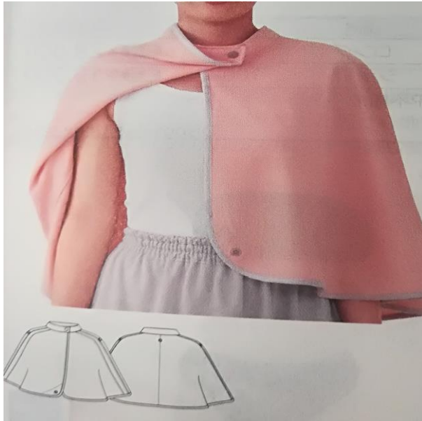
Зураг. Хөхний эхо, маммографи хийлгэх өвчтөний хувцас