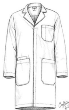
Зураг. Эмч халад эр