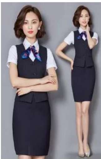
Зураг. Захиргаа, хангамжийн ажилчдын хувцас засал, дурангийн хойшоо