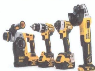
Жагсаалт №6-н зураг