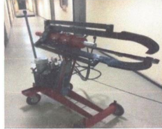
Жагсаалт №9-н зураг