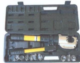
Жагсаалт №27-н зураг