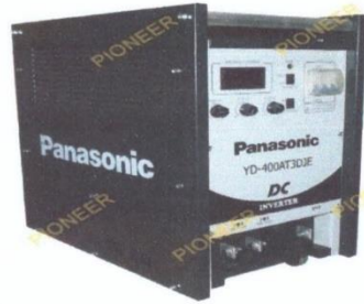
Жагсаалт №8-н зураг