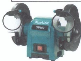
Жагсаалт №3-н зураг