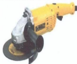
Жагсаалт №4-н зураг