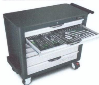
Жагсаалт №2-н зураг