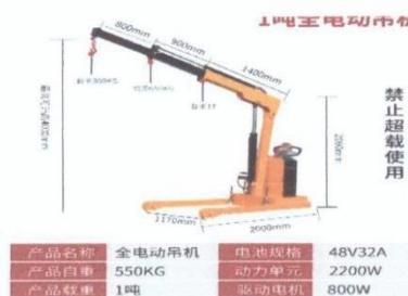
Жагсаалт №1-н зураг