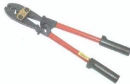
Жагсаалт №25-н зураг