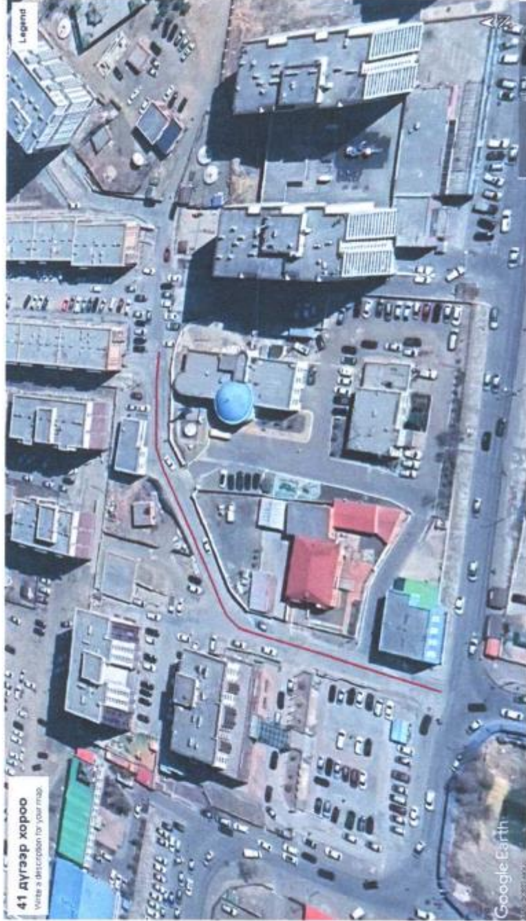
41 дүгээр хороо Улаанбаатар хотын газар