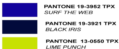
Зураг 3. Ажилтны хувцасны өнгө, PANTONE TRX код

ИТА, удирдлагын өвлийн хувцасны үндсэн өнгө нь хар хөх (PANTONE 19-3933 TRX MEDIEVAL BLUE); туслах өнгө нь хөх цэнхэр (PANTONE 19-3952 TRX SURF THE WEB) өнгө байна.