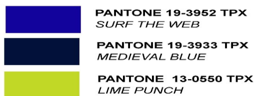
Зураг 4. ИТА -ын хувцасны өнгө, PANTONE TRX код