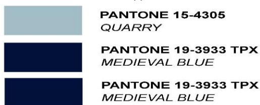
Зураг 5. Удирдах ажилтны хувцасны өн PANTONE TRX код