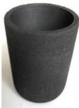
Зураг №1 Графитан тигел