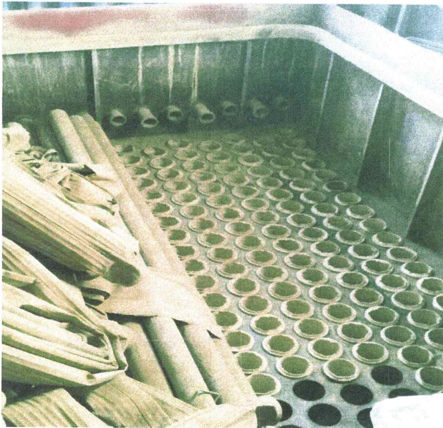
Уут сольж байгаа байдал