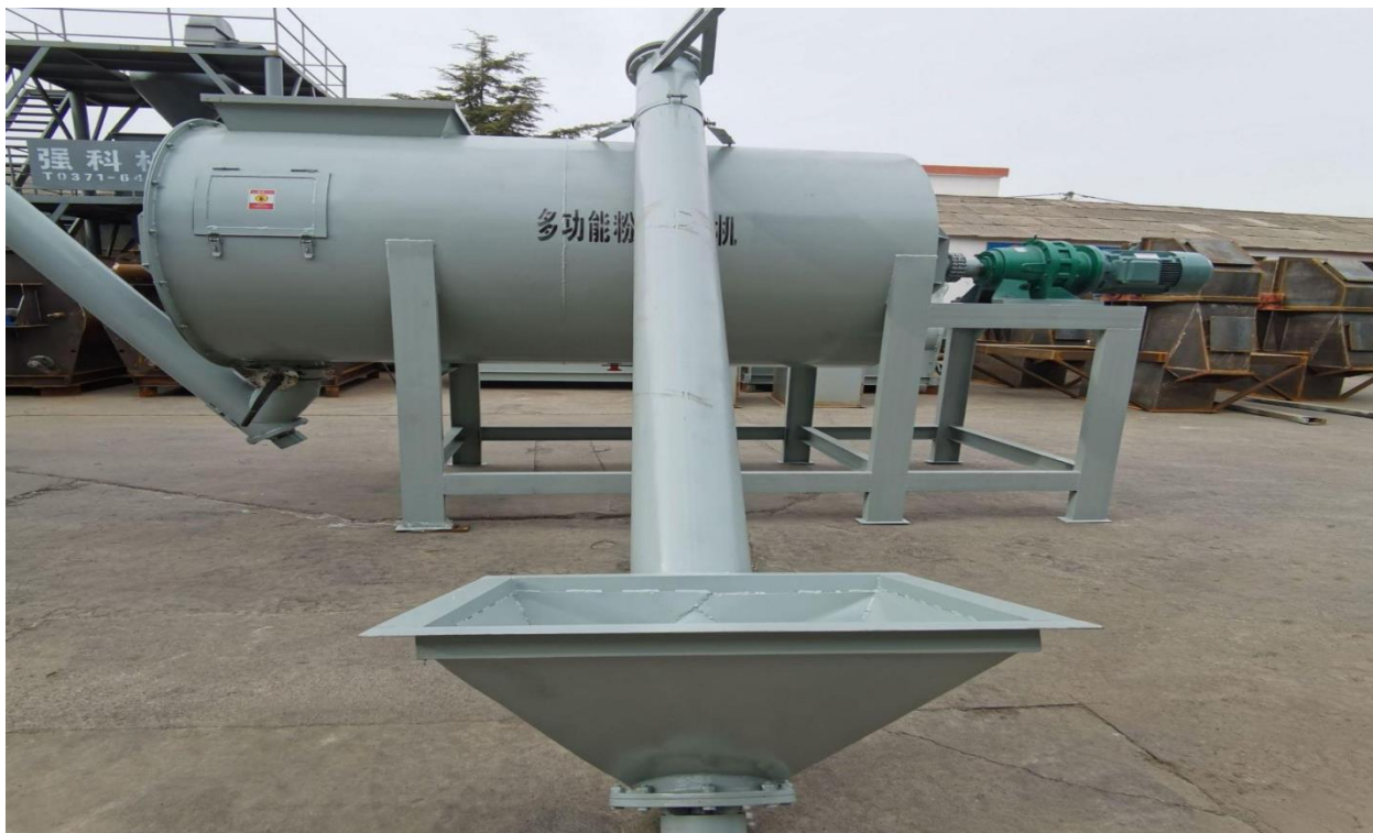
Шаардлагатай бол барааны эскиз, зургийг хавсаргана.