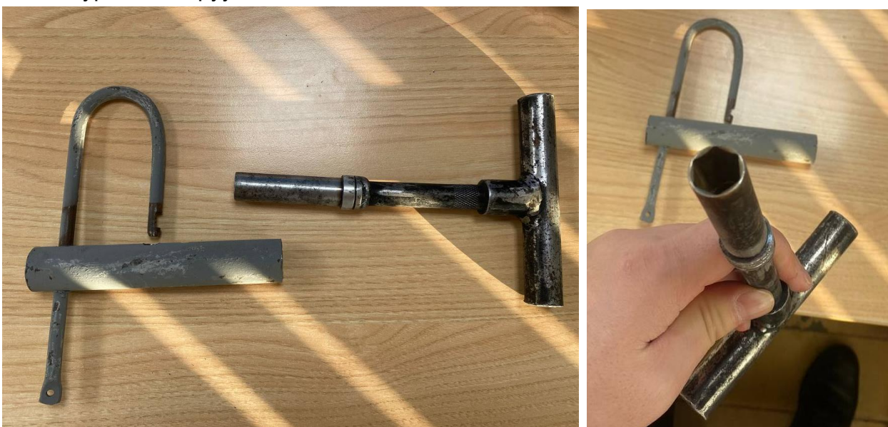
Зураг 5. АЗЗТ-ийн эзэмшлийн АТП-ны цоожны харагдах байдал

АЗЗТ-ийн эзэмшлийн АТП-ны цоож нь 16мм 6 талтай тусгай троцобоор онгойдог байх. /зураг 5-д харуулсан/