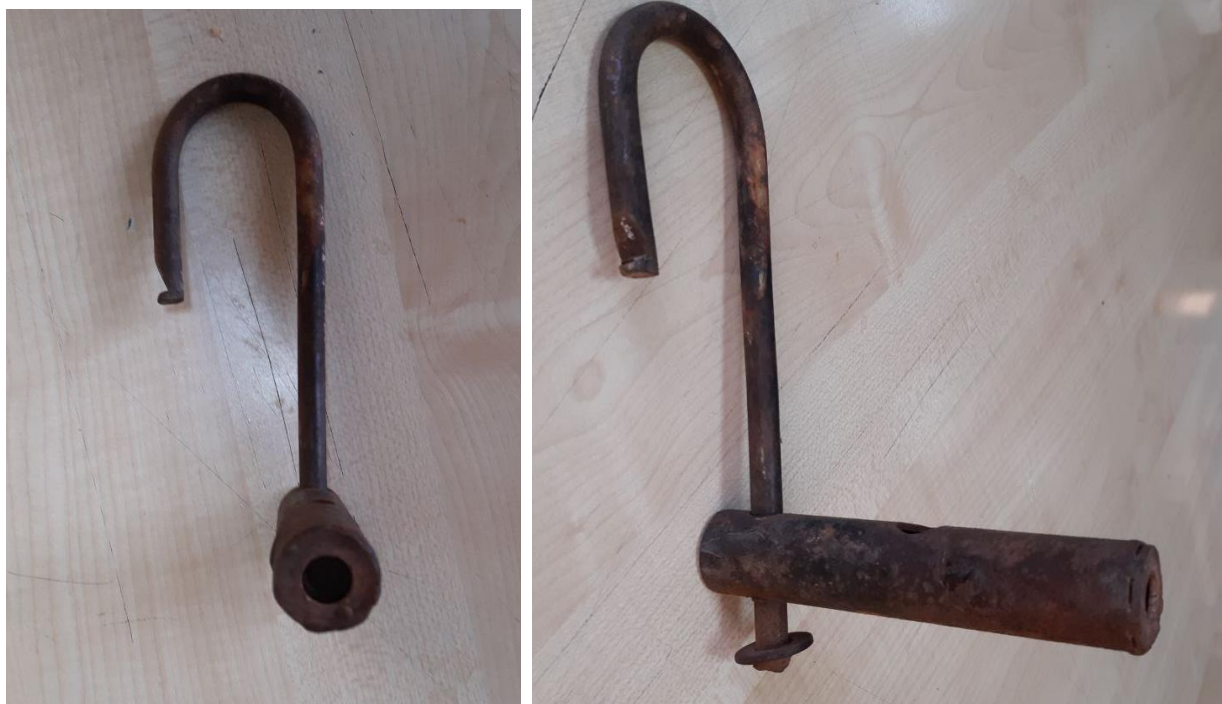
Зураг 6. АЗБТ-ийн эзэмшлийн АТП-ны цоожны харагдах байдал

АЗБТ-ийн эзэмшлийн АТП-ны цоож нь 8мм 6 талтай тусгай түлхүүрээр онгойх боломжтой байх. /зураг 6-д харуулсан./