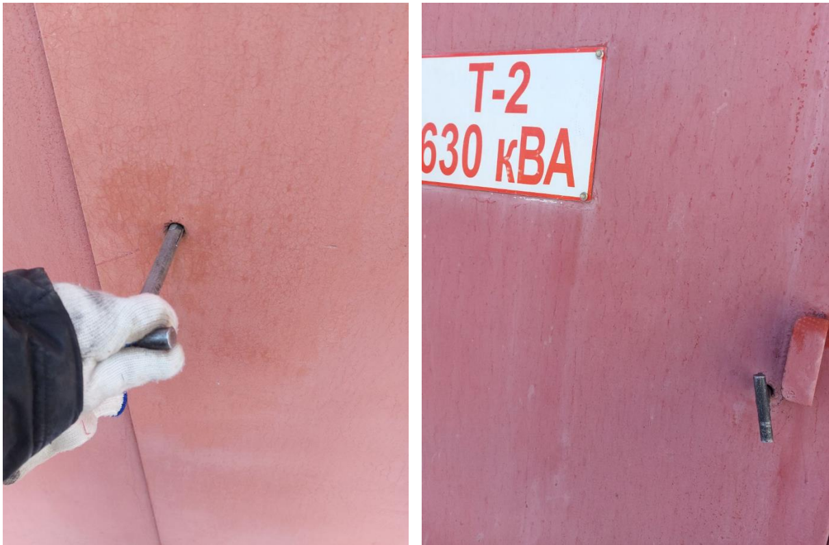
Зураг 2. ХТП-ны далд цоож суурилуулсан байдал. Хаалганы гадна талаас харагдах байдал