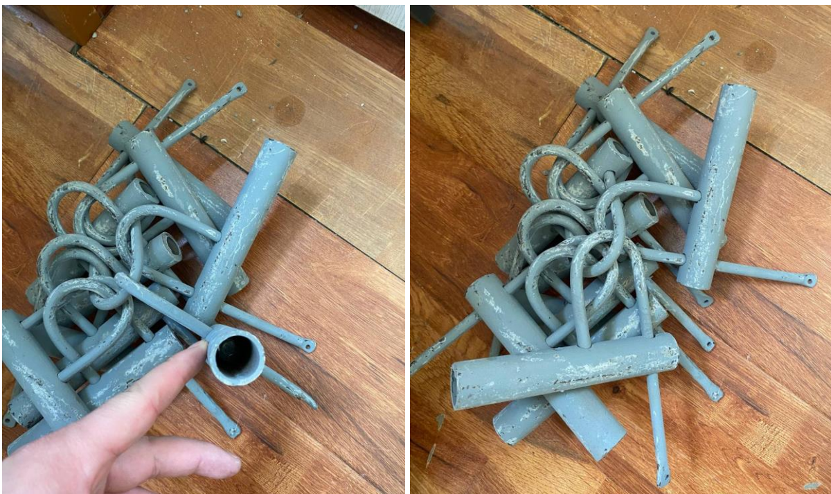
Зураг 4. АЗЗТ-ийн эзэмшлийн АТП-ны щитны цоожны харагдах байдал

АТП-нд хэрэглэх нэг маягийн цоожны 10ш тутамд 1ш түлхүүр байхаар тооцож нэг маягийн түлхүүрийг нийлүүлнэ.