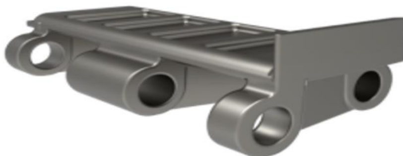
1.3. Фото зураг. Гинжит хавтан