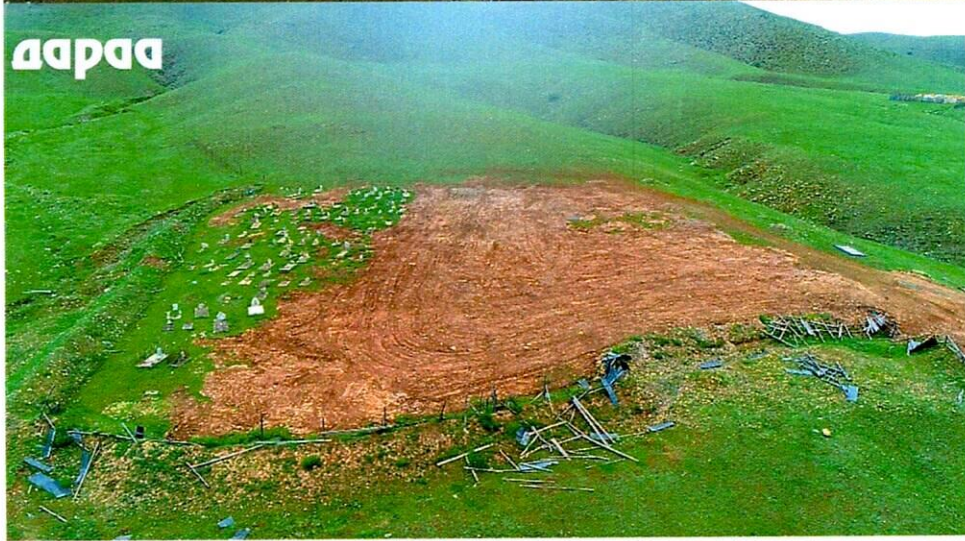
Байршлын зураг /нисэх/-2