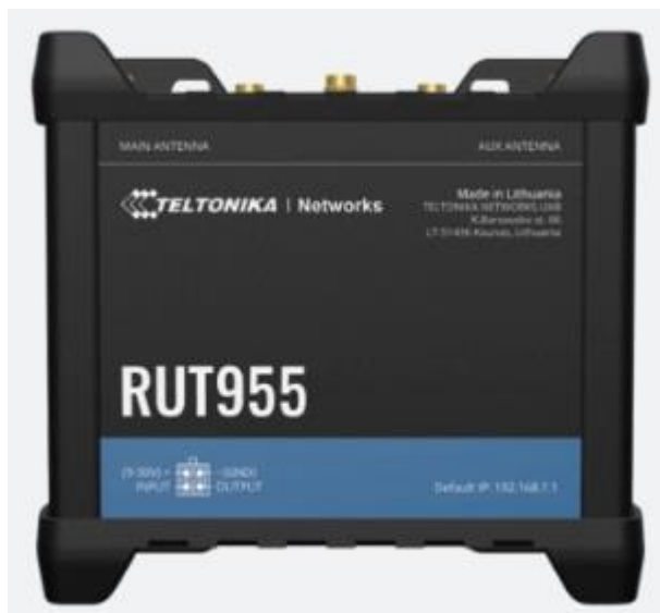
RUT-955 модемтой дүйцэхүйц байна