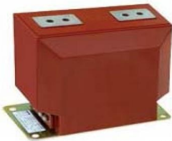
Зураг-1. LZZBJ9-10 загвартай дүйцэхүйц гүйдлийн