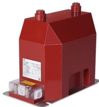
Зураг-1. JDZX10 загвартай дүйцэхүйц хүчдэлийн трансформатор