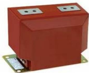
Зураг-1. LZZBJ9-10 загвартай дүйцэхүйц гүйдлийн