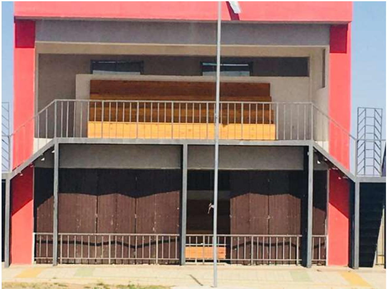
Үе шатны ажлын хуваарь Ажлын гүйцэтгэлийг хянаж шалгахад үе шатны ажлын хуваарийг ашиглана.