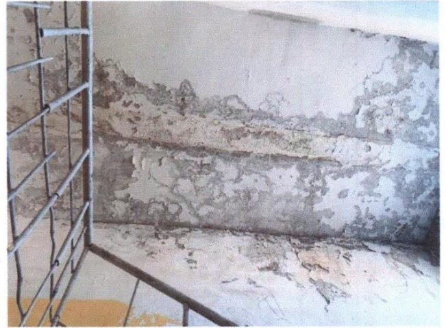
Шатны дээд талын тааз