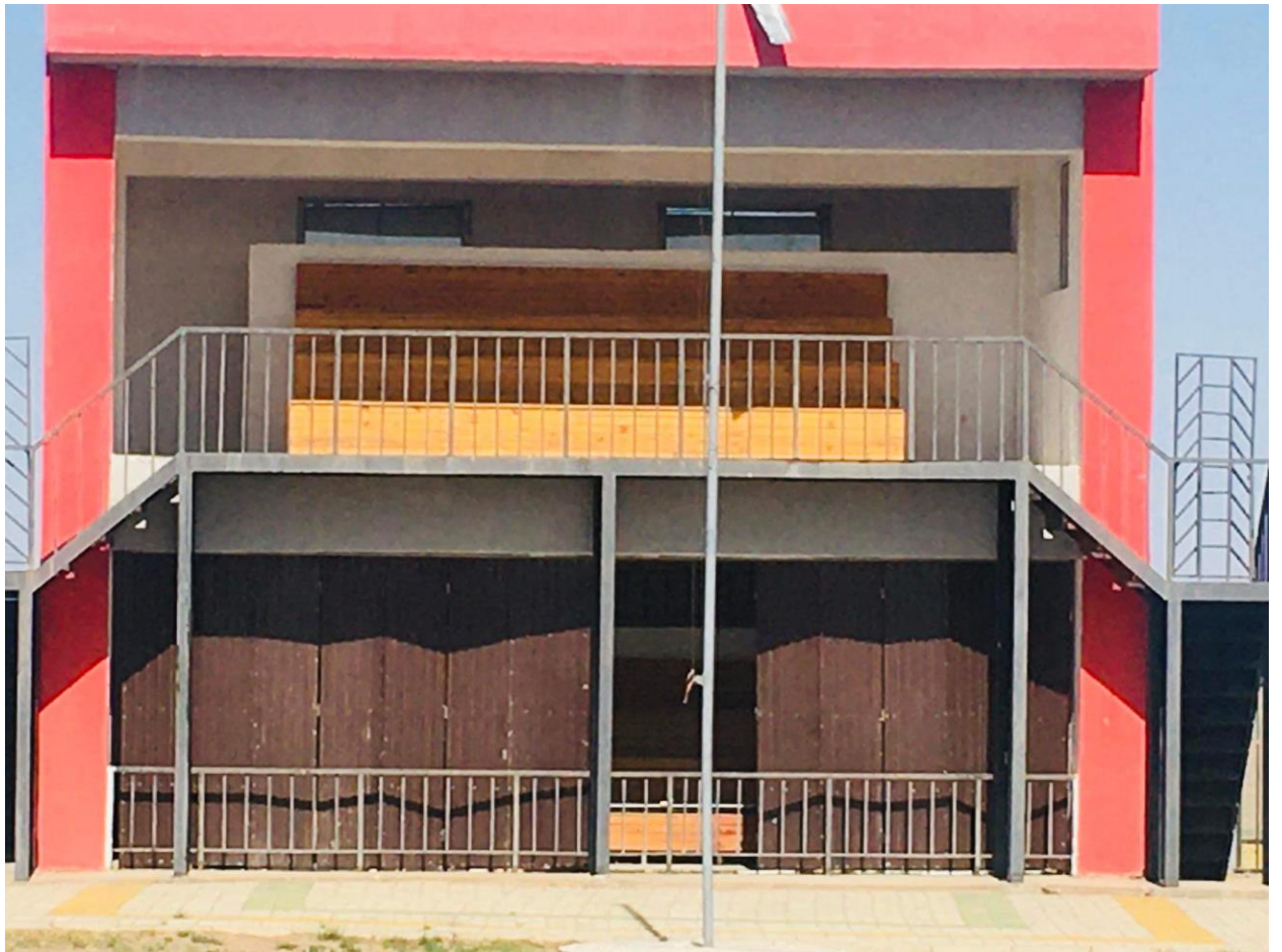
Үе шатны ажлын хуваарь Ажлын гүйцэтгэлийг хянаж шалгахад үе шатны ажлын хуваарийг ашиглана.