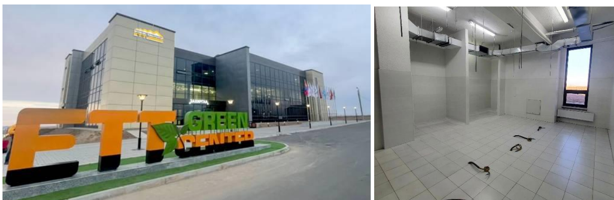
Грийн центр болон өрөөний зураг

Өмнөговь аймгийн Цогтцэций сум дахь Грийн центрийн Захиргааны байрны нэг давхрын серверийн өрөө.