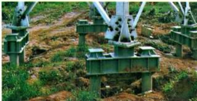
Зураг-1: 110 кВ –ын анкер тулгуурт гадсан суурийг иж бүрнээр суурилуулсан байдал