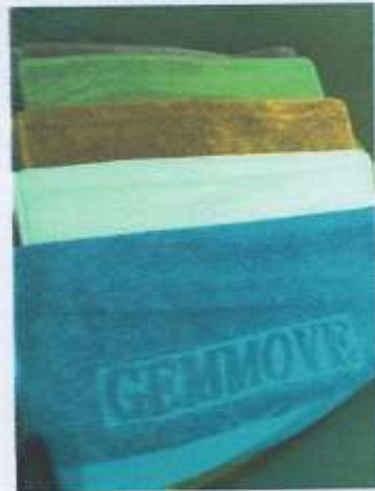
Ус даах чадвартай, материал сайтай