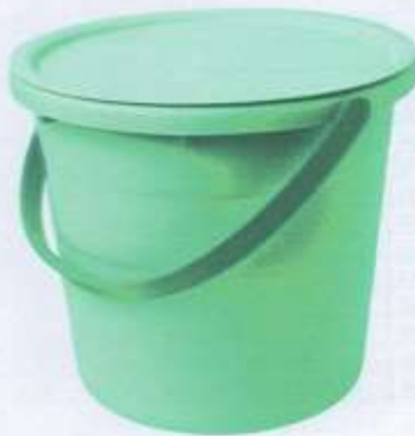
Зузаан материалтай, цэвэрлэгээ Үйлчилгээнд тохирсон, эдэлгээ даах