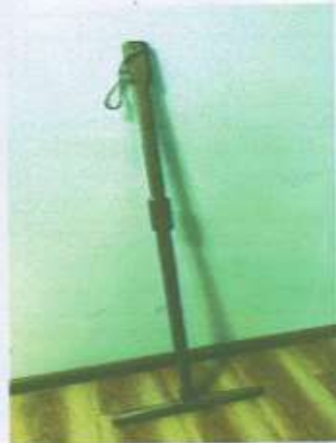
Урт иштэй, бие урттай, мод сайтай