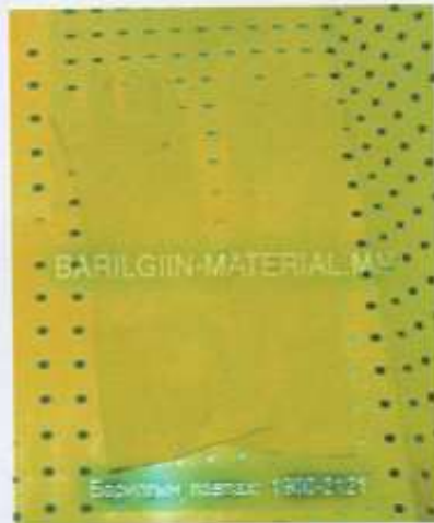
Зузаан зөөлөн, материал сайтай урт ханцуйтай