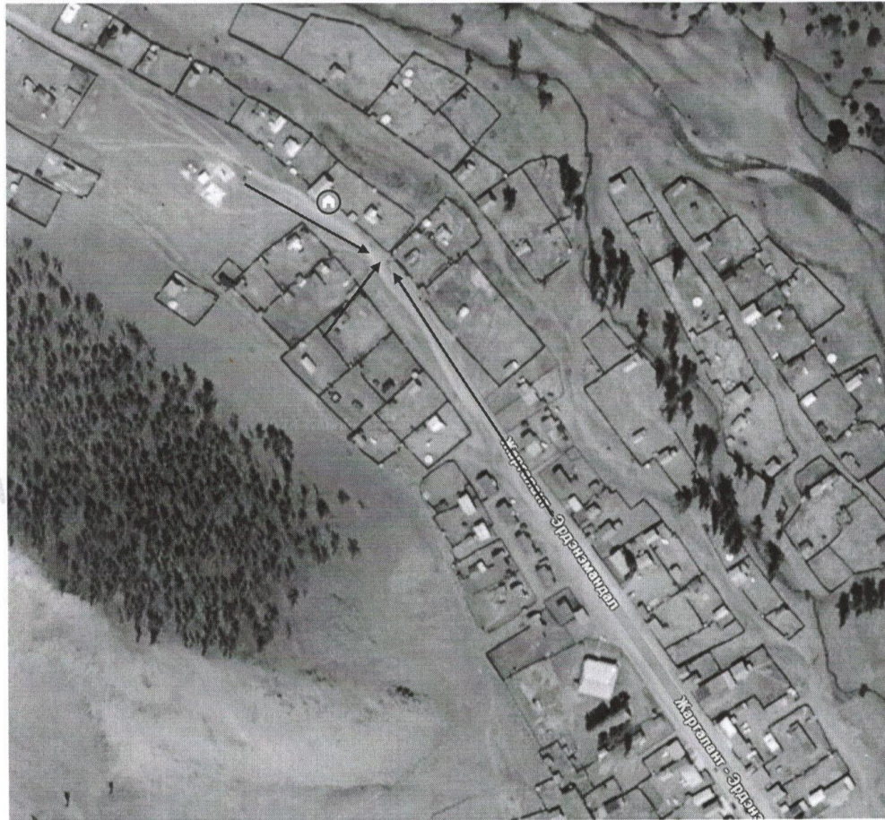
Гуерийн далан хийх хэсгийн зураглал/